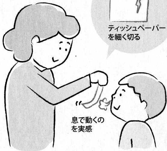
息で動くの を実感