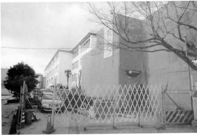
右に建築中の学童保育の建物 (中部小正門にて)

② 保育園に続いて学童保育も入所希望が急増だ。保育園同様待機児童を発生させない取り組みは評価したい。但し児童一人当たり面積など不十分な点は改善を。量が多いからと質を低下させない事。